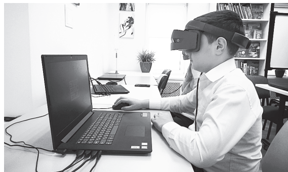
В библиотеке им. А.С. Пушкина.