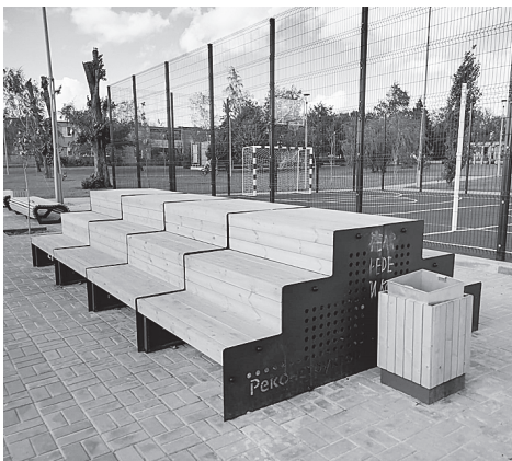
Трибуны для болельщиков.