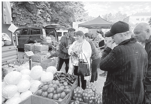
А здесь капуста и лук.