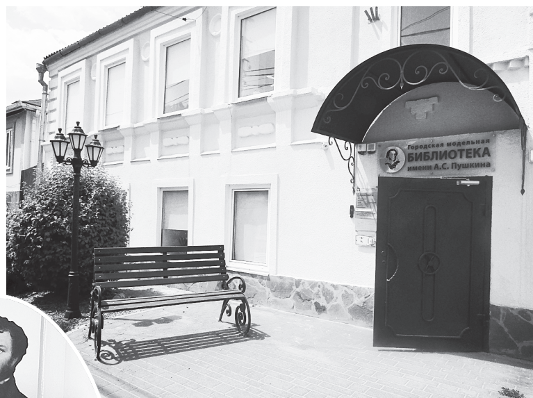
Библиотека им. А.С. Пушкина

В 2020 году в Аксайском районе была открыта и вторая модельная библиотека – городская библиотека имени А.С. Пушкина. Здесь были созданы все условия для разных категорий читателей, а современная техника удачно вписалась в историческое пространство «Пушкинской гостиной», где проходят занятия литературного салона «При свечах». А в летний период