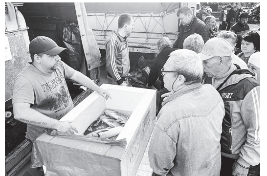
Можно и рыбки купить.