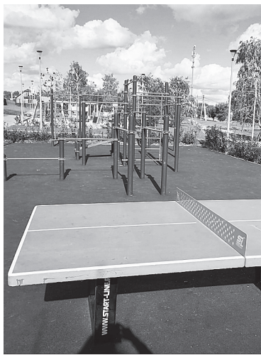
Спортивная и игровая площадки.