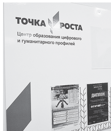
В «Точке роста» Янтарной СОШ проходят уроки ОБЖ, информатики и технологии, занятия по робототехнике, шахматам, финансовой грамотности, действуют дебат-клуб и фотокружок.

но актуально для сельских школ, близость которых к природе позволяет выполнить большой