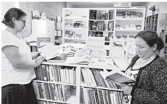
В Старочеркасской модельной библиотеке.