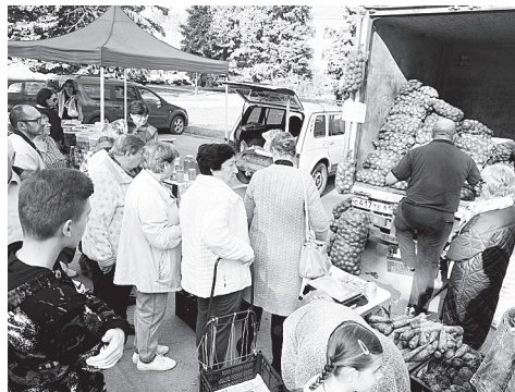
Картофель разных сортов.