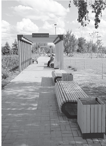
Зоны отдыха выполнены в едином стиле.

Красивые арки, удобные скамейки, детские качели «Гнездо», двухпролетный игровой гимнастический комплекс, перголы, столы и скамейки для игры в шахматы и шашки – такой красоты и в городе не увидишь. Подрядчик ООО «Евро-