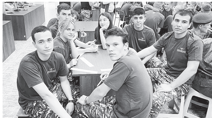
Аксайский район представила команда «Гвардия».