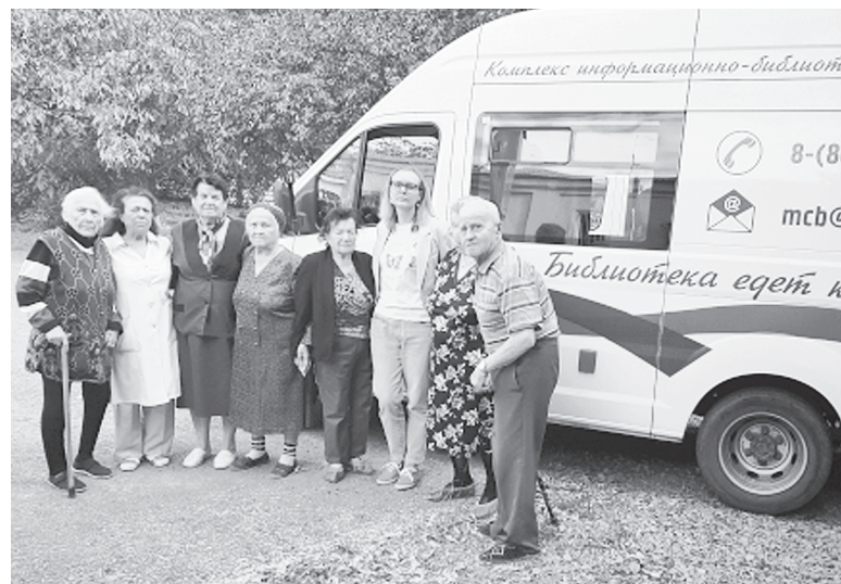
КИБО по дорогам района.

можно почитать книги в «Пушкинском дворике».