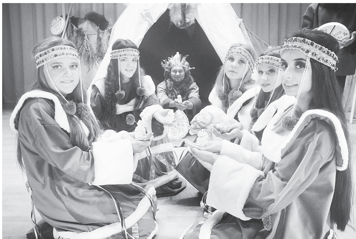
Образцовый ансамбль танца «Радуга» представляет чукотский танец на фестивале «Дон многонациональный». 2021 год.

31 августа в рамках проекта «Национальная кофейня» в Ок-