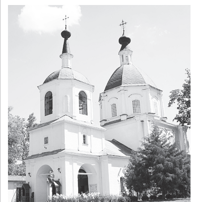
Церковь Петра и Павла в ст. Старочеркасской.

Всего в этом году ребята побывали в девяти муниципалитетах. Они посетили ст. Старочеркасскую, г. Шахты, г. Новошахтинск, г. Донецк, г. Азов, г. Ростов-на-Дону, Зимовниковский, Мясниковский, Миллеровский районы.