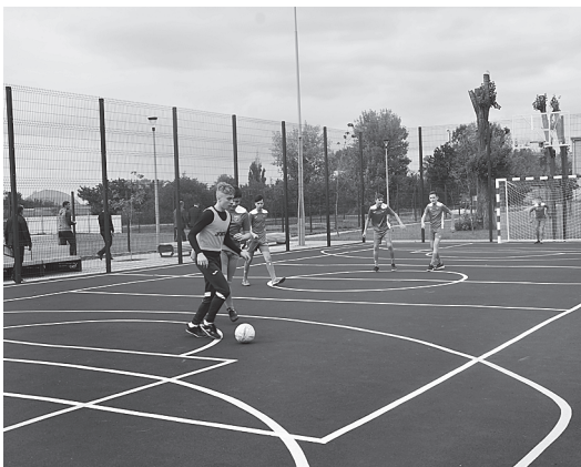
Дети уже играют в футбол.