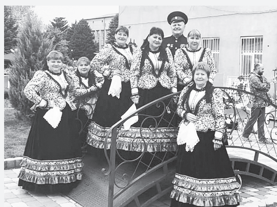
Народный вокальный ансамбль «Луговчанка».