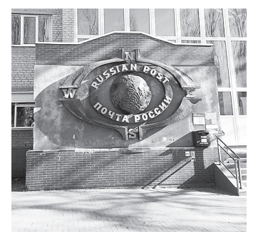
Аксайский почтамт.

В Аксайском районе в 2022 году в проекте участвуют девять сельских отделений Аксайского почтамта: в хуторах Ленина, Островского, Большой Лог и Верхнеподпольный, поселках Александровка и Красный Колос, станицы Старочеркасская, Грушевская и Мишкинская. Во всех отделениях Почта России делает комплексный ремонт внутри помещений, а также обновит фасады зданий. В них будут новые противопожарные системы, комфортная мебель и современная оргтехника. Кроме того, увеличится количество услуг, доступных для клиентов: теперь они смогут подтвердить или восстановить личность в ЕСИА.