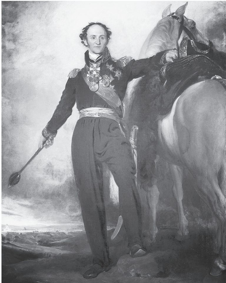
Атаман Матвей Иванович Платов во время визита в Англию. 1814 год. Художник сэр Томас Лоуренс.

В 1774 году Матвей Иванович Платов впервые показал себя как хладнокровный и умелый военный руководитель. Он быстро построил из повозок оборонительный круг и бился с турками хана Девлет-Гирея до подхода вызванного на помощь казачьего полка. Турки были разбиты, а хан вскоре был арестован и доставлен к турецкому султану в Константинополь. Так имя Матвея Ивановича Платова впервые стало известно широкой общественности.