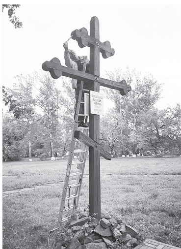
Казаки покрасили крест возле войсковой часовни и провели День древонасаждения.

Представители казачьих молодежных организаций и школ со статусом «казачьи» проводят спортивные соревнования.