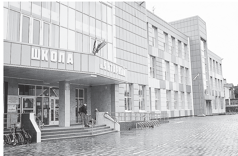
Заседание «круглого стола» проходило в стенах школы поселка Янтарного.

– Считаем, что необходима своя региональная программа по