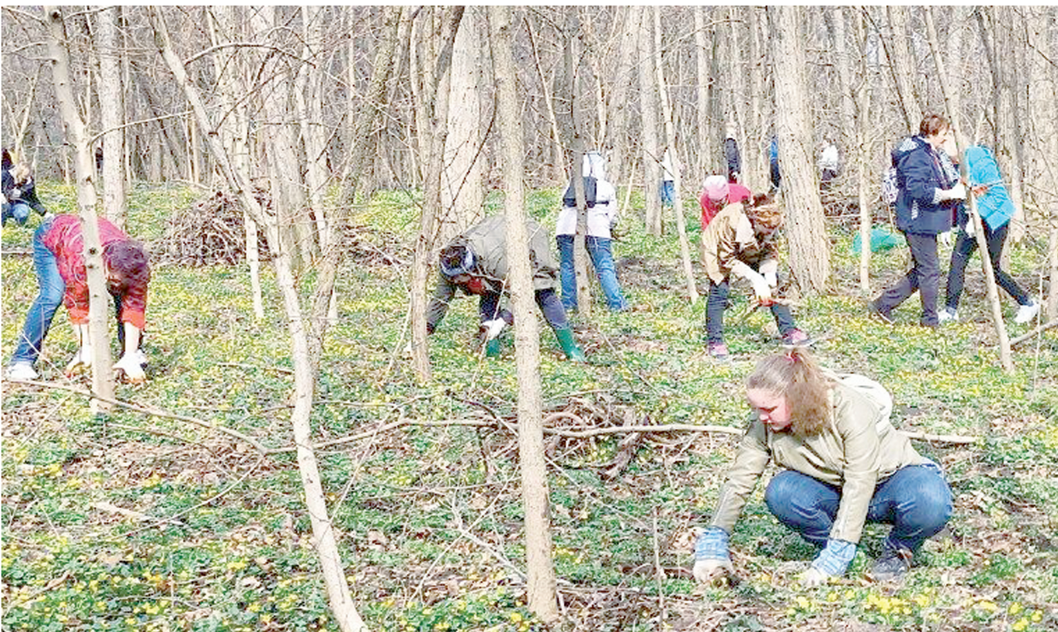
Наведение порядка на территории экопарка Мухина балка.

В ПРОШЛЫЕ ВЫХОДНЫЕ АКСАЙЧАНЕ СОБРАЛИСЬ НА ЭКОЛОГИЧЕСКОМ СУББОТНИКЕ В МУХИНОЙ БАЛКЕ