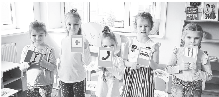
Воспитанники детского сада с дорожными знаками.

Проблема детской дорожной безопасности актуальна всегда. Особое опасение вызывает перевозка детей в салоне автомобиля. Не всегда родители используют детские удерживающие устройства и ремни