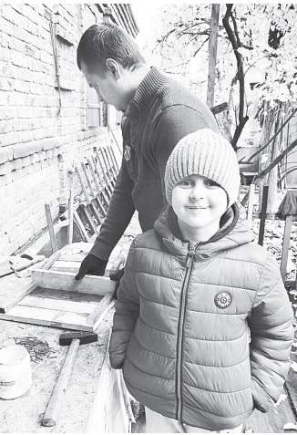
Саша с папой.