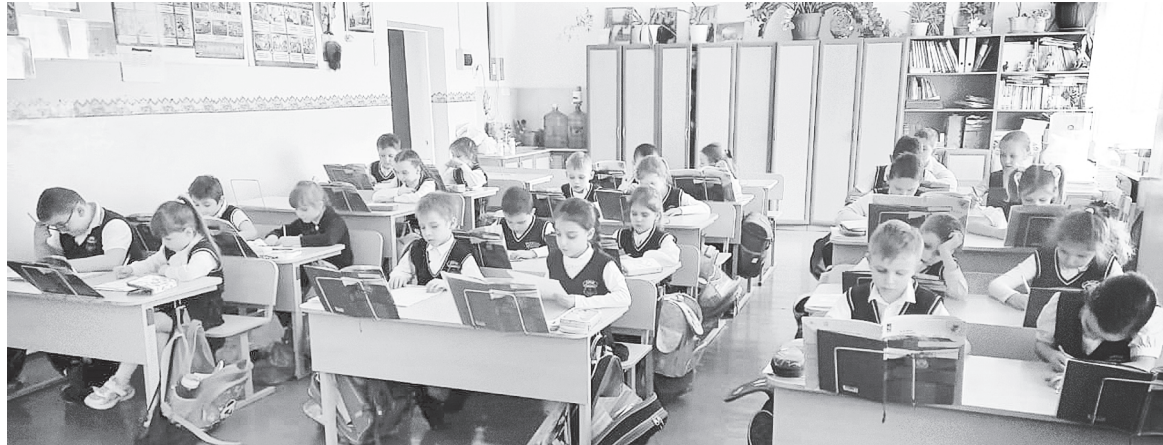
Пишем сочинение.

В тексте Матвея описана очень простая детская мечта. Он написал так: «Я мечтаю кататься на горке, на каруселях, гулять в парке и играть с родителями. Мне бы хотелось, чтобы они не ходили на работу, а проводили время вот так весело, со мной».