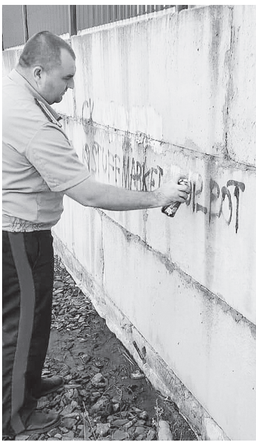
Казачи Аксайского юрта регулярно проводят мероприятия по антинаркотической пропаганде.

Врач психиатр-нарколог ГАУ РО «Наркологический диспансер» в Аксайском районе М.П. Окопная отметила, что в настоящее время на учете в Аксайском наркологическом кабинете состоят 167 человек. Сняты с диспансерного наблюдения в связи с выздоровлением 13 человек и еще восемь – в связи со смертью.