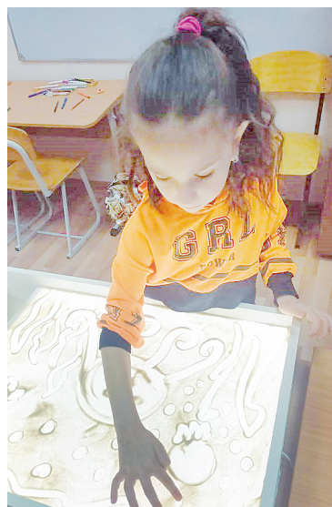
Песочная терапия.