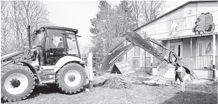
Обустройство детской площадки в детском саду «Колосок».

– Сейчас площадку ровняют, устанавливают большую беседку, сделаем игровую зону с резиновым покрытием, плиткой выложим дорожки. Вкладываем в наше общее будущее, в наших детей, – рассказал Сергей Владимирович.