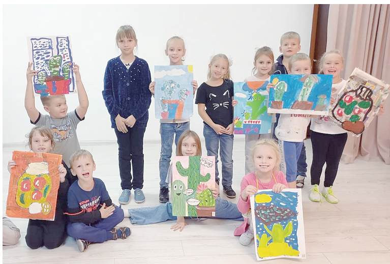
Каждый месяц среди детских объединений проводят конкурс внутри клуба, на фото – «Семейный кактус».

На занятиях воспитанники Центра творчества детей и молодежи рисуют песком, создавая порой не просто рисунки, а целые мультики. Занимаются они по двум техникам. Первая – по светлomu фону высыпа-