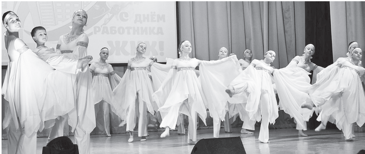
Ансамбль танца «Мэри Дэнс».

Праздничное настроение работникам жилищно-коммунального хозяйства и бытового обслуживания подарили творческие коллективы РДК «Факел».