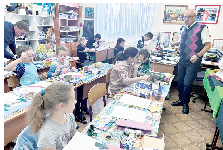
Занятия по рисованию всегда проходят в теплой и домашней обстановке.