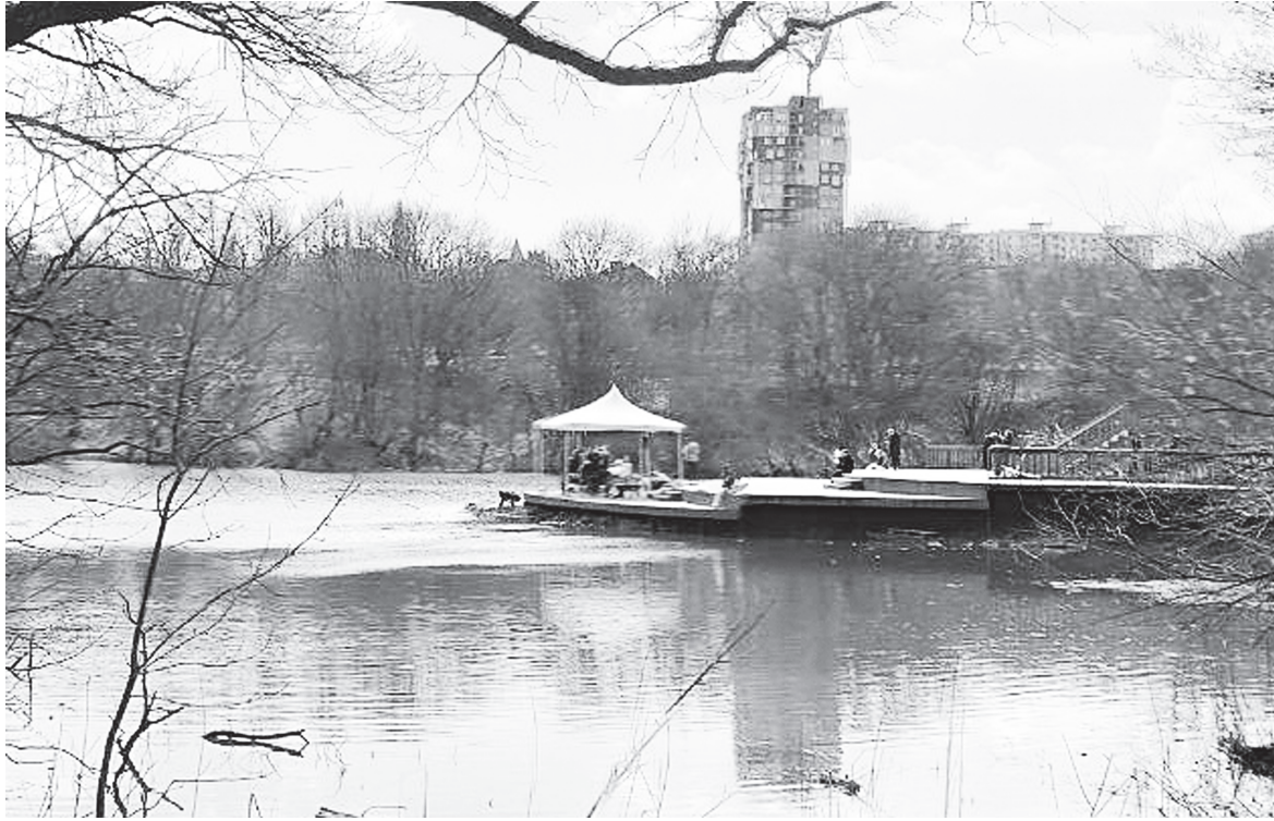
Продолжается реконструкция Мухиной балки.

УДИВИТЕЛЬНЫЙ УГОЛОК ПРИРОДЫ – МУХИНА БАЛКА