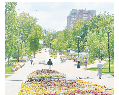
Аллея на К. Либкнехта г. Аксая.

Индекс рассчитывается на основании шести критериев, включающих 36 индикаторов. При расчете учитываются уровень безопасности, комфорта, экологичность, идентичность и разнообразие городской среды, ее современность, актуальность и эффективность управления. Среди городов Ростовской области самый высокий балл получил г. Аксай (236 баллов), на втором месте – Таганрог (235 баллов), на третьем – Азов (226), на четвертом – Ростов-на-Дону (223 балла). Индекс качества городской среды составляется на протяжении пяти лет. Все эти годы г. Аксай входит в число лидеров областного рейтинга.