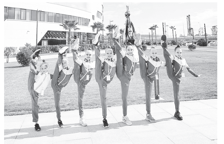
Гимнастки спортивной школы № 1.

Воспитанницы Спортшколы № 1 показали достойные результаты и на областных соревнованиях Ростовской области по художественной гимнастике. Их выступления были яркими и красочными.