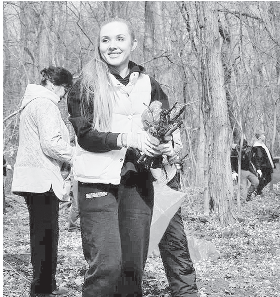
Уборка сухостоя и веток.