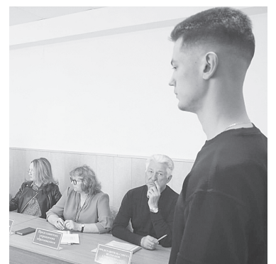
Призывная комиссия Российской Федерации.