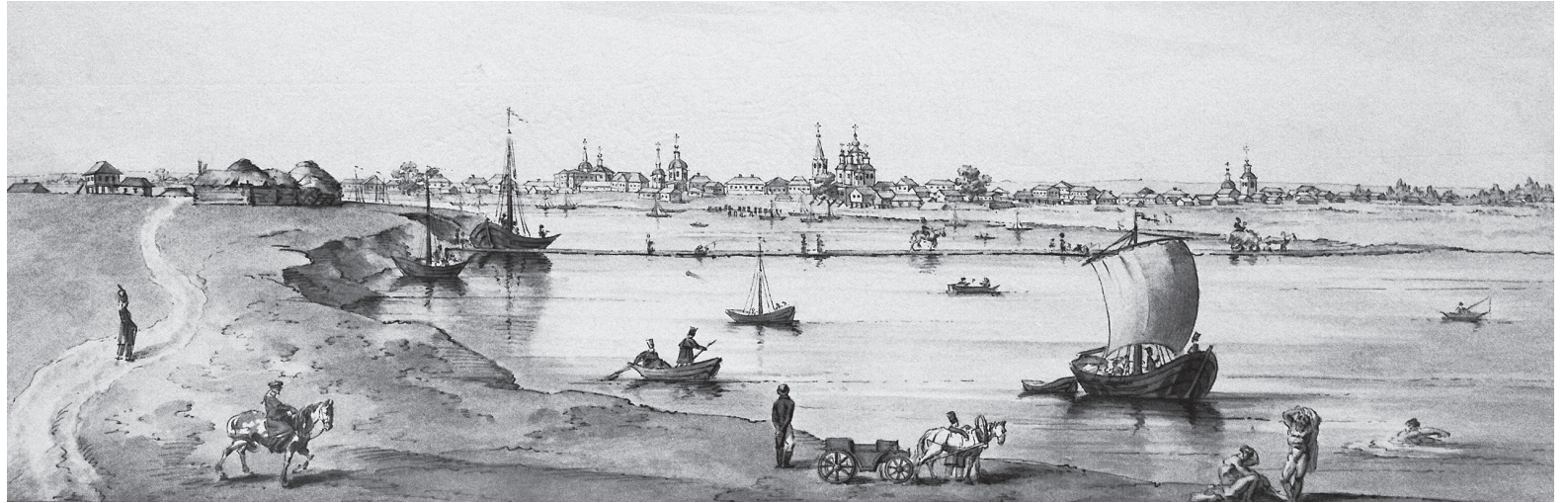
Акваель «Вид города Черкаска». 1803 год.

СУДЬБЫ ГОРОДОВ И СТАНИЦ ЧЕМ-ТО СХОЖИ С СУДЬБАМИ ЛЮДЕЙ