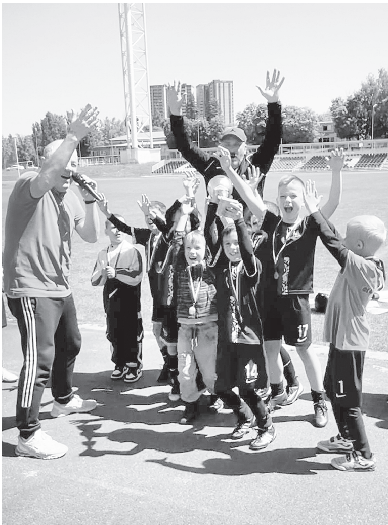
Команда СШ № 1 – победитель турнира по мини-футболу, города Ростов-на-Дону.

Юрий Александрович родом из Абхазии. Там он вырос, окончил школу. Там он полюбил спорт. Он серьезно занимался гандболом, был в составе команды мастеров. Его отец был чемпионом СССР по пулевой стрельбе, сестра увлекалась большим теннисом, а старший брат – самбо. Вокруг Юрия Александровича всегда был спорт. Поэтому, когда пришла пора определяться с профессией, выбор был очевиден. В Ростове-на-Дону он поступил в Ростовский государственный педагогический университет РГПУ (сейчас ЮФУ), получил специальность преподавателя по физической культуре и спорту. Ю.А. Ткаченко работал в детском саду, средней общеобразовательной школе, был директором центра спортивной подготовки и заведующим кафедрой физического воспитания в Ростовском государственном строительном университете. Он тренировал университетские команды по регби (спортсмены стали чемпионами России среди студентов по регби-9) и мини-футболу (команды были бронзовыми призерами ЮФО и СКФО). А еще Юрий Александрович развивал регби в Аксайском районе.