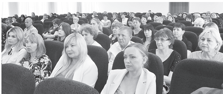
Во время совещания.

«Безопасный город». Проведена проверка маршрутов школьных автобусов. В Аксайском районе действует 45 школьных маршрутов, по организованному подвозу детей в школы. Школьные автобусы соответствуют требованиям безопасности, подключены к автоматизированному центру контроля Ространснадзора и системе ЭРА ГЛОНАСС, а также интегрированы в АПК «Безопасный город». Заключены контракты на предос-