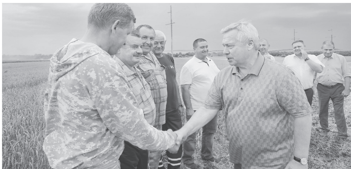
Несмотря на неблагоприятные погодные условия, донские сельчане собрали достойный урожай

– Упорный труд сельчан, опыт, грамотная подготовка к каждому сезону, – подчеркивает губернатор, – все это позволяет Ростовской области уже несколько лет подряд