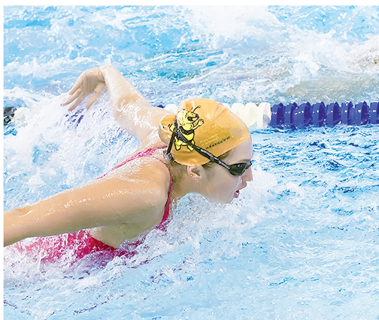
Занятие в детской группе по плаванию.