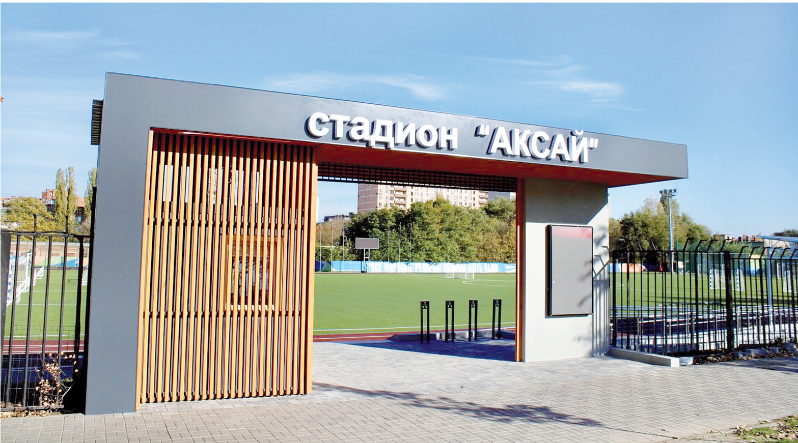
Входная группа стадиона «Аксай».

– Стадион можно без преувеличения считать гордостью нашего города. Да, вход был. Но не вписывался он в общую концепцию этого красивого спортивного сооружения. И новая входная группа придала статусности, издали видны теперь буквы, что это городской стадион «Аксай». Новый и современный вход на городской стадион позволит сделать его посещение наиболее безопасным и комфортным для всех жителей города. Удобно и маломобильным горожанам, для их передвижения обустроены пандусы. Есть велопарковка, охранное помещение, козырек над трибуной, мультимедийный экран, на котором транслируются объявления о работе стадиона, правилах посещения, о предстоящих спортивно-массовых мероприятиях,