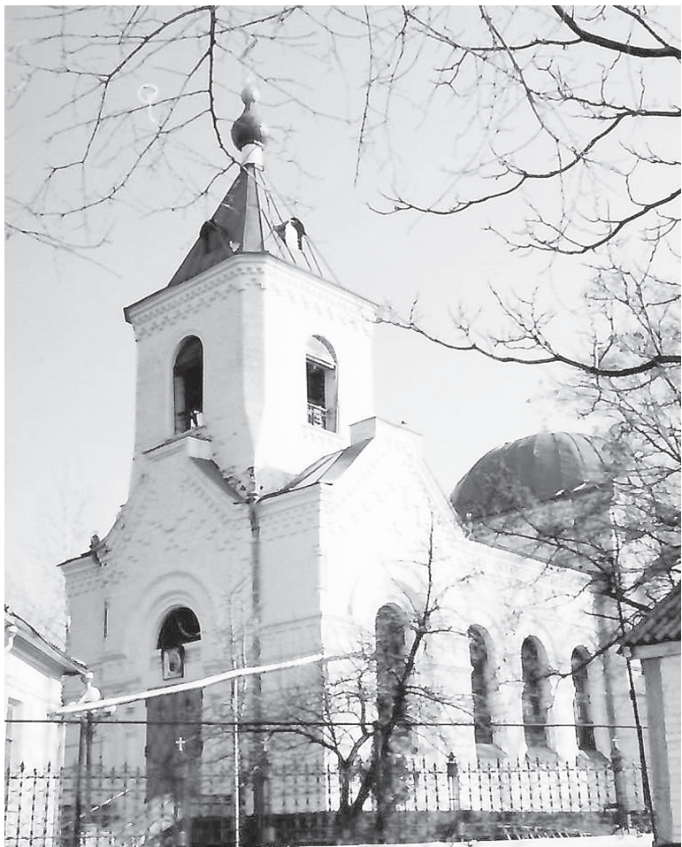
Храм Одигитрии.

В августе 1830 года в станице Аксайской началась эпидемия холеры, унесшая много жизней. Богоматерь стала являться во сне местным жителям. Она просила