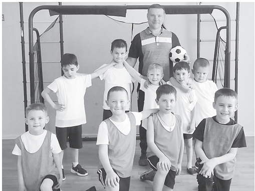
Футбольная команда.