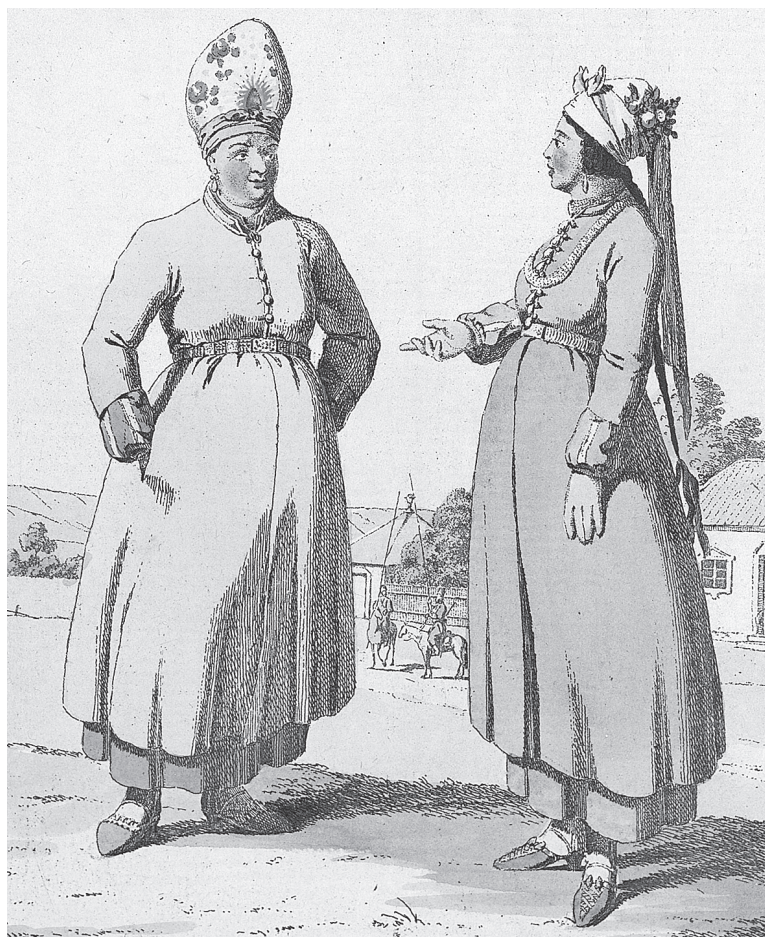
Х.Г. Гейслер. Замужняя казачка в головном уборе, закрывающем волосы, и молодая девушка с вплетенной в косу лентой из Черкаска.

ки: замужняя, кормящая дитя, и молодайка, потупив очи долу, принимающая ухаживания военного.