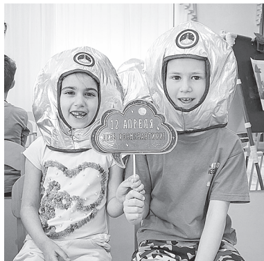
С Днем космонавтики!