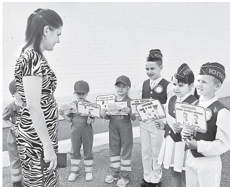
Дошколята рассказывают родителям о безопасности дорожного движения.