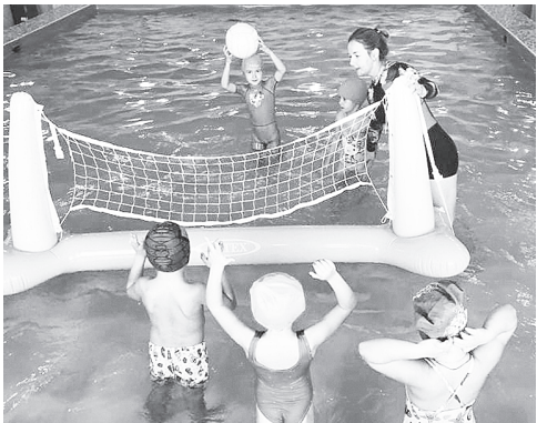
Занятие в бассейне.

Признаемся честно, этот детский сад произвел на нас большое впечатление. Нам стало понятно, почему родители привозят сюда детей даже из Ростова. Здесь у детей точно есть все для того, чтобы получить полноценное развитие.