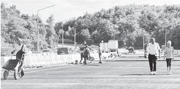
Идет ремонт на 1056-м и 1060-м км трассы М-4 «Дон».

По информации госкомпании «Автодор», в Ростовской области идет ремонт двух путепроводов на 1056-м и 1060-м км трассы