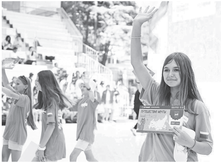
В качестве приза победители отправятся в путешествие во Владивосток.

вали будущую конструкцию и сделали из пластилина макет. Участие в конкурсе стало для школьницы