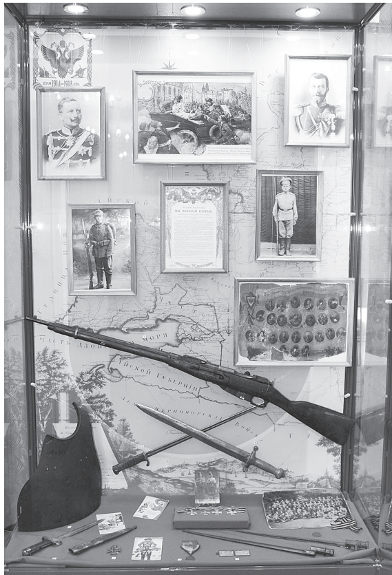
Фрагменты выставки: «Великая и забытая война».