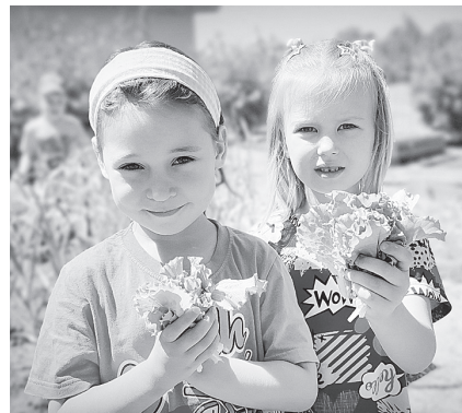
Вот и вырос на огороде салат.