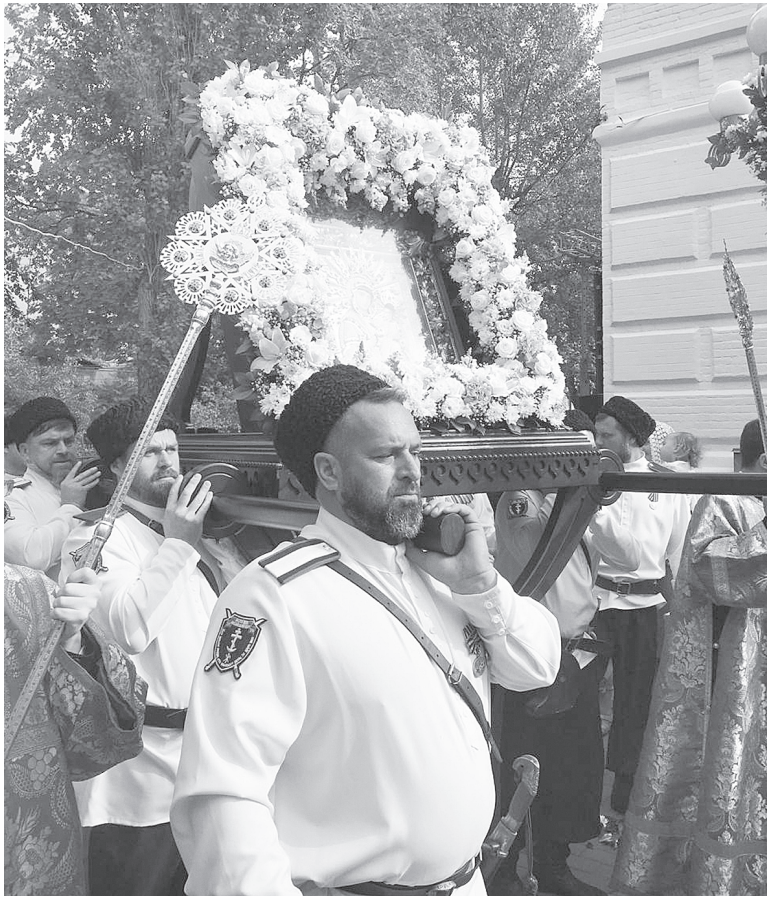
Крестный ход с Аксайской иконой Божией Матери.

10 АВГУСТА АКСАЙСКИЙ ХРАМ СМОЛЕНСКОЙ ИКОНЫ БОЖИЕЙ МАТЕРИ «ОДИГИТРИЯ» ОТМЕЧАЕТ СВОЙ ПРЕСТОЛЬНЫЙ ПРАЗДНИК