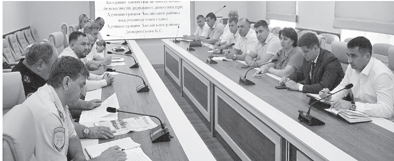
Участники заседания.

По информации врио начальника отделения ГИБДД, на территории Аксайского района наблюдается рост числа дорожно-транспортных происшествий. Увеличение числа ДТП объясняется, прежде всего, непрерывно увеличива-