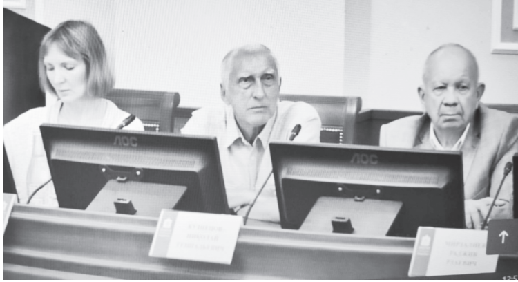
Во время круглого стола.

Все эти требования в полном объеме не выполняются не в нашем районе, не в 38 муниципальных образованиях Ростовской области, о чем сообщил в своем выступлении первый заместитель министра общего и профес-