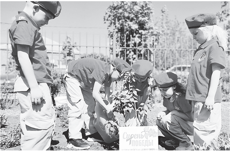
Юные патриоты высаживают сирень Победы.