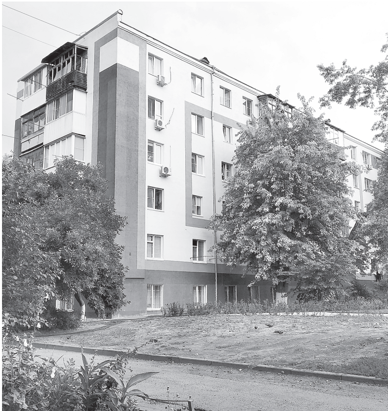
ТСЖ «Вдохновение» на проспекте Ленина, 33.

– Вот чтобы и впредь работа шла ритмично и безопасно, надо все держать под контролем. Руководители ответственных организаций обучаются в системе Ростехнадзора с целью поддержания в исправном состоянии и навыка