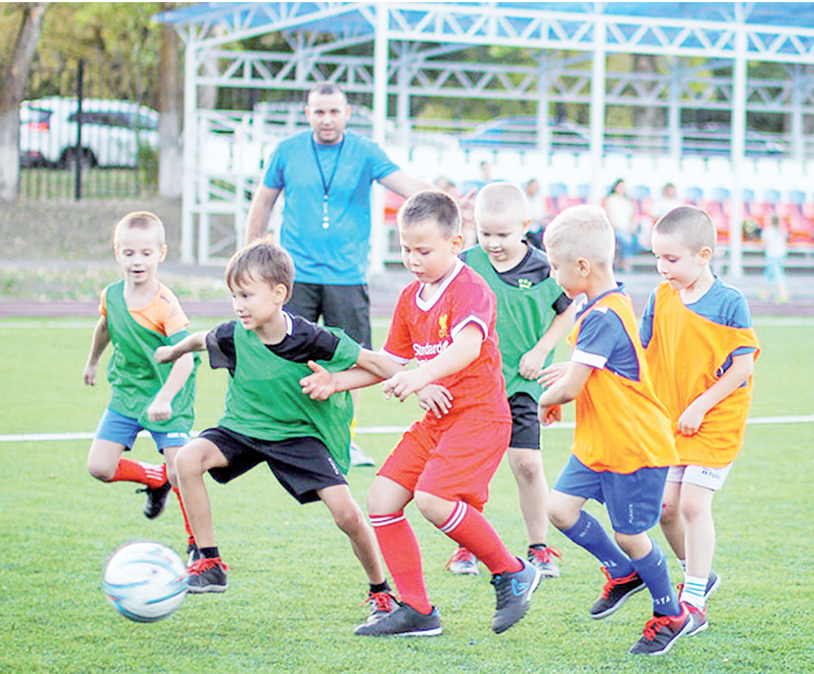
Занятия в детской группе по футболу.