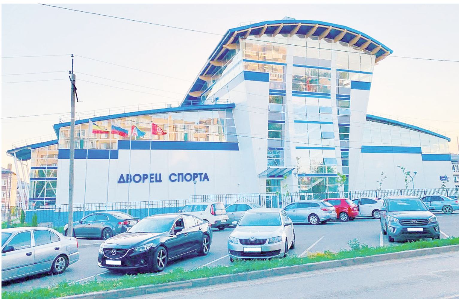
Дворец спорта города Аксая.

А ЕЩЕ ДВОРЕЦ СПОРТА – ЭТО ОДНА ИЗ ВИЗИТНЫХ КАРТОЧЕК ГОРОДА