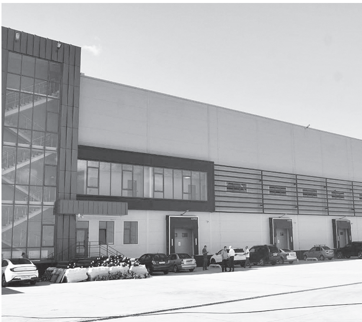
РСК «Юникосметик».

Открытие комплекса создаст не только новые рабочие места с достойной заработной платой, но и обеспечит новые налоговые поступления в бюджет, которые будут направлены на дальнейшее развитие Аксайского района.