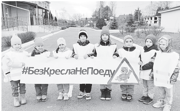
Юные помощники инспекторов движения в деле.

модан, кто-то наручные часы. Появились пуговицы от гимнастерки, фотографии газет военного времени. Воинская часть тоже внесла свою лепту – передала маскировочную сеть, солдатскую каску, котелок, буденовку, телефонный аппарат тех времен. Нашлось здесь место для поделок, посвященных