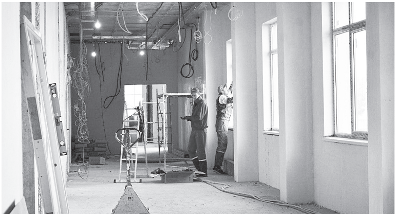
Строительство новой школы идет полным ходом.