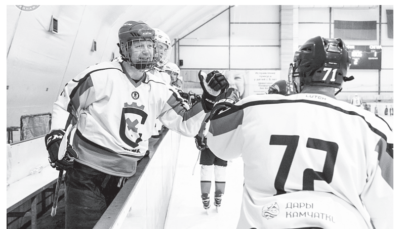
Вперед – к победе!

– Мы же понимаем, кого нам по силам обыграть. С равными соперниками, с одной стороны, тяжело, с другой – очень интересно играть. На самом деле, я бы так вопрос не ставил – вот конкретно эту команду хотелось бы обыграть. Побеждать всегда хочется!