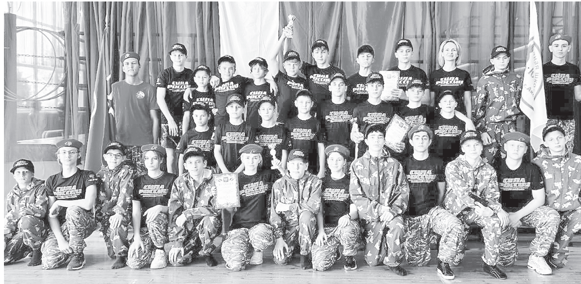
Участники турнира от Аксайского района.

За фото и видеосъемку выражаем благодарность медиацентру «Ракурс» (Аксайская школа № 2) и лично Арине Рассединой.