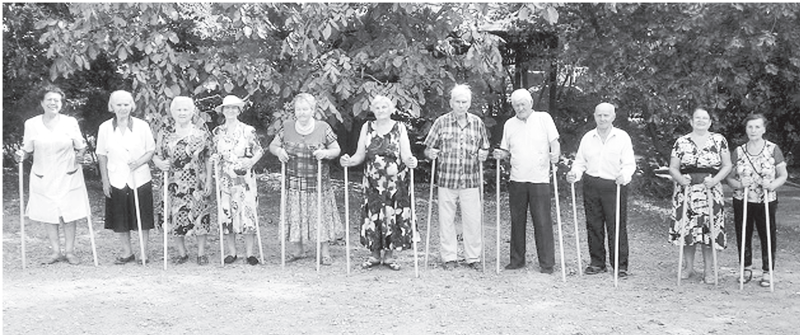
Скандинавская ходьба в Центре социального обслуживания.

В первую очередь, он негативно влияет на сердечно-сосудистую систему, обмен веществ и иммунитет. Помочь бороться со стрессами вам сможет помочь дыхательная гимнастика, аутогенный тренинг, общение с природой, с близкими людьми, увлечение музыкой, спортом и просто юмор. Все это прекрасные лекарства и есть профилактика стресса и депрессий. Положительные эмоции и душевное равновесие позволяют жить дольше и здоровее.