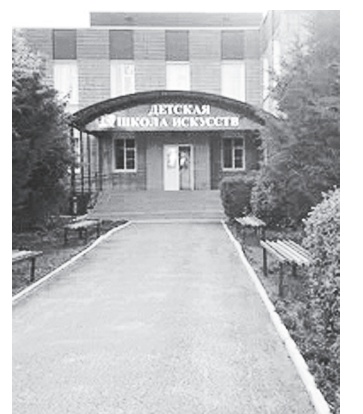
Детская школа искусств в п. Рассвет.