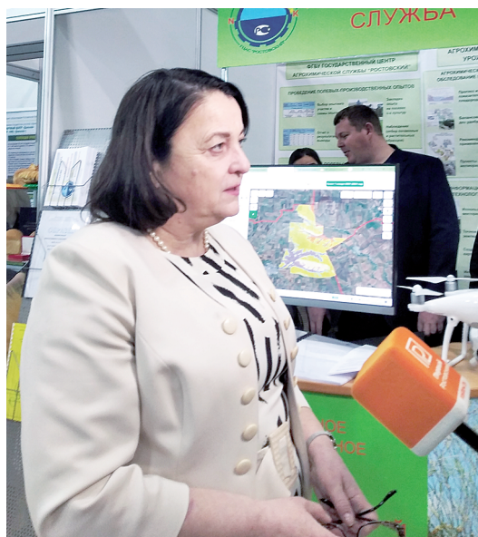
На выставке «Интерагромаш. Агротехнологии» КВЦ «Вертол-Экспо».

Пресса назвала роль агрохимической службы – стоять «на страже урожая». И это так. Каждое лето, имея дело с оперативными районными сводками по уборке зерновых и зернобобовых, видишь, что при прочих равных условиях наивысшей урожайности добиваются из года в год одни и те же. Мне показали справку-перечень договоров на агрохимическое обслуживание полей, которые заключают землепользователи