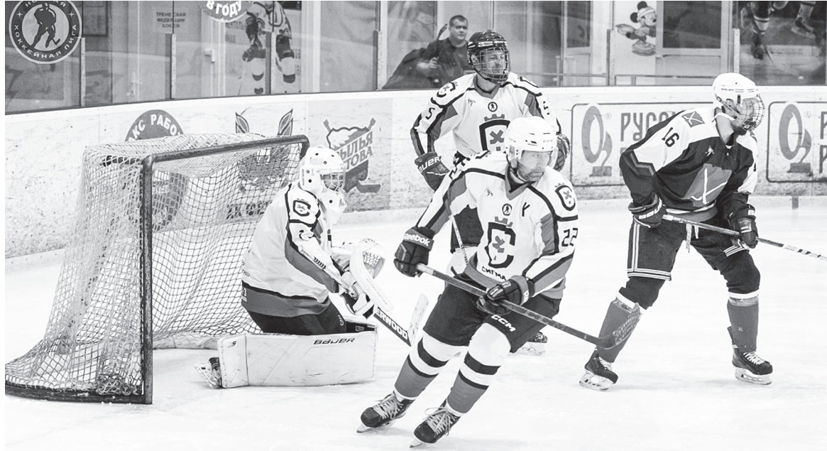
Момент игры команды «Сигма».

АКСАЙСКАЯ КОМАНДА ЛЮБИТЕЛЕЙ ХОККЕЯ «СИГМА» НЕ ПРОПУСТИЛА С МОМЕНТА ОБРАЗОВАНИЯ НИ ОДНОГО СПОРТИВНОГО СЕЗОНА