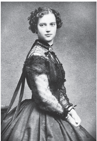
Принцесса Дагмара.

По поводу болезни медики и сейчас не пришли к единому мнению. В сентябре 1864 года Николай, будучи в полном здравии, заключил помолвку с дочерью датского короля Христиана IX принцессой Дагмарой и продолжил путешествие. В Италии ему стало плохо, цесаревича привезли для лечения в Ниццу. Там, у постели умирающего любимого брата, и произошло зна-