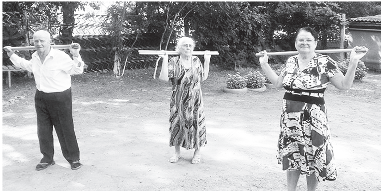
На зарядку!