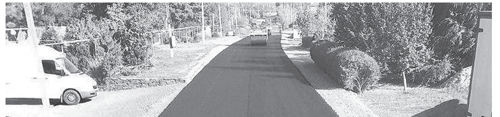
В х. Большой Лог ведутся работы по ремонту автодороги по ул. Фадеева.