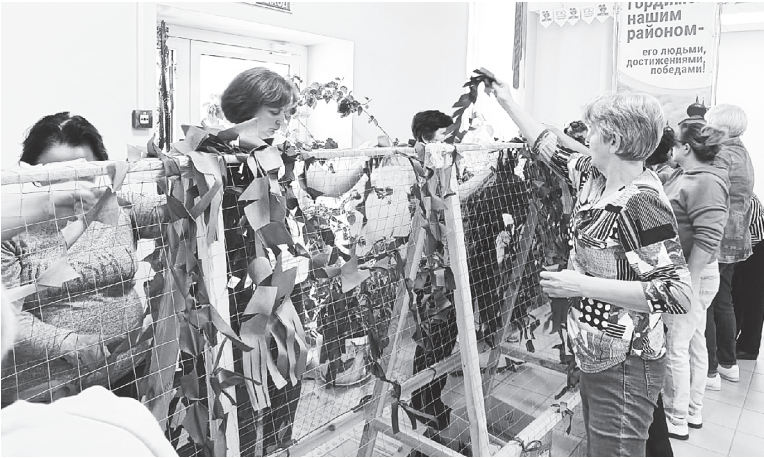
Жители плетут маскировочные сети.

Периодически из Аксайского района с гуманитарным грузом к границе выезжают волонтеры, жители, чтобы лично выразить слова благодарности и поддерж-