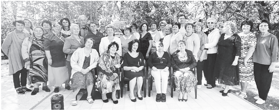
Аксайское отделение «Союза пенсионеров Дона».