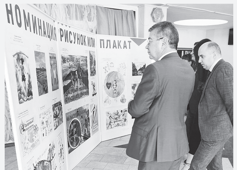
Выставка рисунков и плакатов.

начальник службы по обеспечению деятельности антинаркоти-