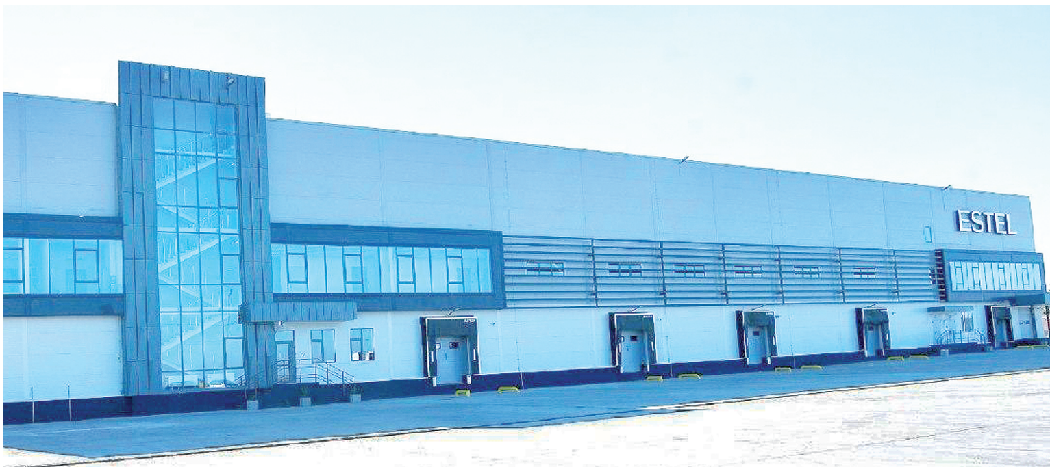
Новый логистический комплекс.

9 ОКТЯБРЯ В СТАНИЦЕ ГРУШЕВСКОЙ АКСАЙСКОГО РАЙОНА ЗАПУСТИЛИ ЛОГИСТИЧЕСКИЙ КОМПЛЕКС КОМПАНИИ «ЮНИКОСМЕТИК»