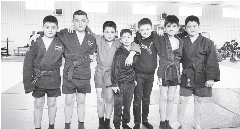
Юные самбисты.

– Нароботанность движений проявляется за счет многократного повторения приема, когда за счет мышечной памяти тело повторяет неоднократно задействованную схему движения. Приведу простой пример из жизни. Если вы каждый день ходите одной и той же дорогой, вы запомните ее и, даже если вдруг нужно будет пойти в другую сторо-