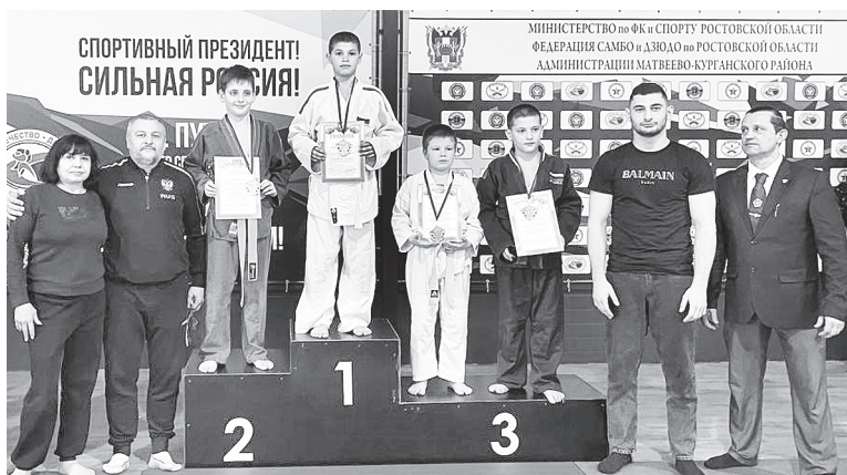
Аксайчане – на пьедестале почета!

Когда отработка приема закончилась, ребятам дается время, за которое они должны выполнить молниеносные броски. Один быстро бросает на мат, другой мгновенно встает после броска. Такое упражнение можно выполнять не больше 30 секунд. Помимо отработки техники оно тренирует скорость, выносливость и тот самый автоматизм. Как только ребята отдохнули, начинается отработка различных вариантов схваток, в том числе борцовские приемы в партере (на коленях). Кстати в любом боевом искусстве очень важно уметь правильно падать. Именно этому начинают учить тренеры начинающих спортсменов. Если при падении боец правильно сгруппировался, ему не будет больно, когда он приземлится на мат.