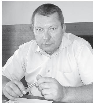
В.К. Соцкий.

– Да, ранних зерновых в этом году собрано чуть более 84 тыс. тонн при средней урожайности 33 ц/га. Это, конечно, меньше прошлогоднего, но для нынешних условий неплохо. Однако в отдельных хозяйствах урожайность озимой пшеницы составила и 79 ц/га, и свыше 64, и больше