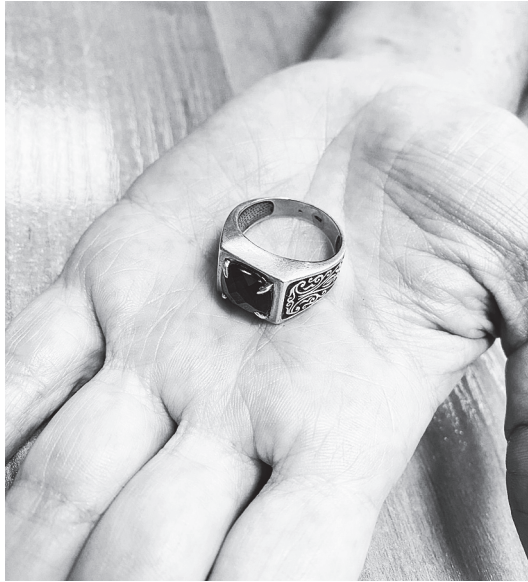
Подаренное ей кольцо.

Перспектива переезда пугала ее до мурашек, до внутренней паники. В этот момент ей, как никогда раньше, нужна была чья-то поддержка, но поддержать было уже