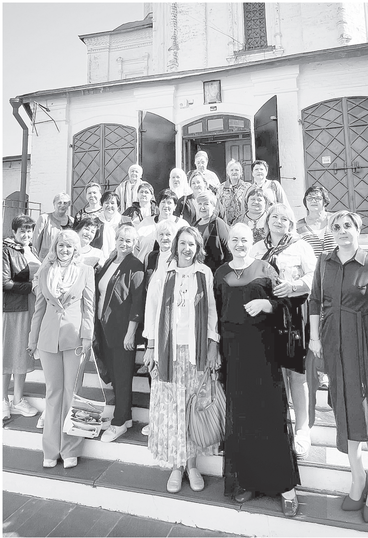
Члены общественной организации в станице Старочеркасской.