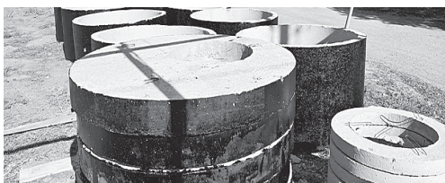
Обустройство канала.

Кроме того, за счет средств Грушевского сельского поселения в этом году очищены дренажные каналы по ул. Пушкинская (520 м), дренажный канал от ул. Советская, по ул. Данилова и ул. Фрунзе (996 м), запланирована расчистка дренажного канала протяженностью 300 м по ул. Советской (в районе Бабина моста).