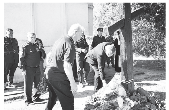
Награждение отличившихся казаков и возложение цветов на Каплице.