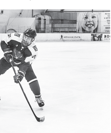
Шайбу! Шайбу! / ФОТО с официального сайта Ночной хоккейной лиги

■ Как складывается соревновательная жизнь в НХЛ? Какие турниры проходят в течение спортивного сезона?