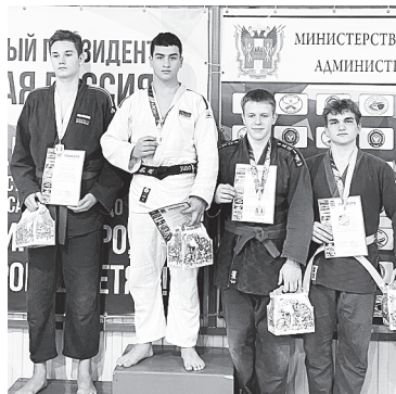
Наши – с медалями.