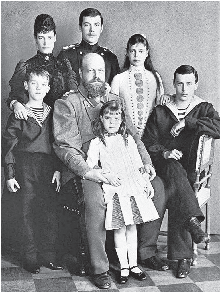
Семья императора Александра III.

комство будущего императора Александра III с принцессой Дагмарой. Общая потеря сблизила их.