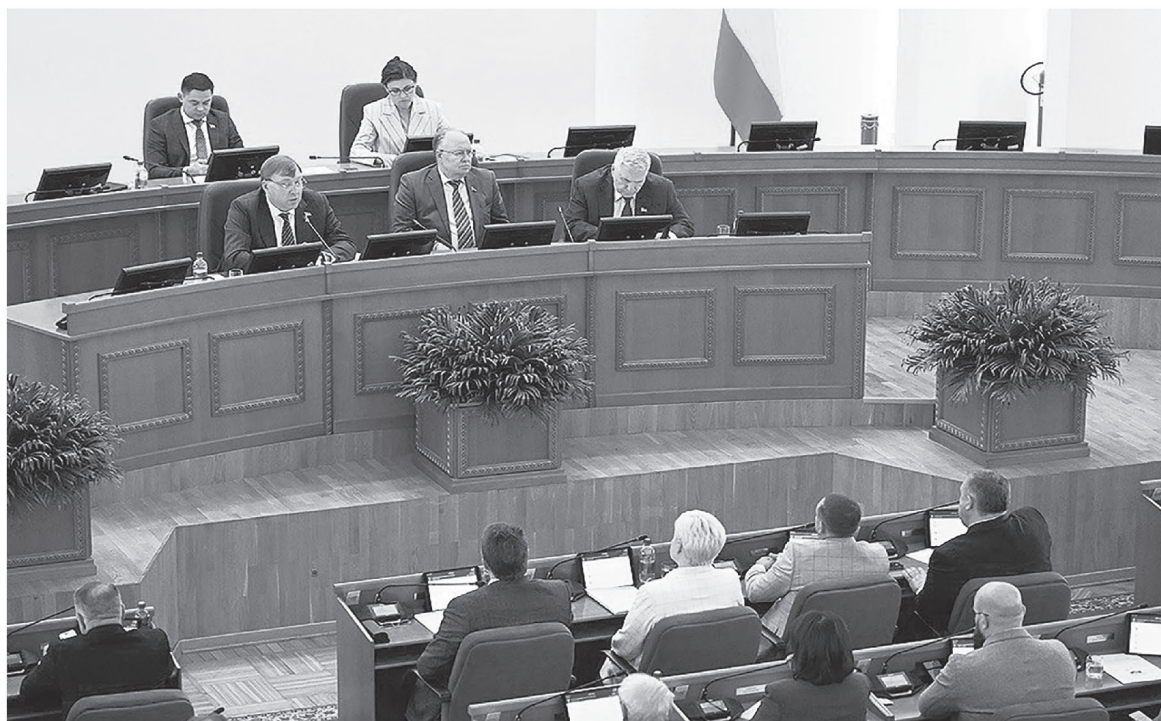
По мнению депутатов, проблема энергоснабжения в регионе должна решаться комплексно и оперативно