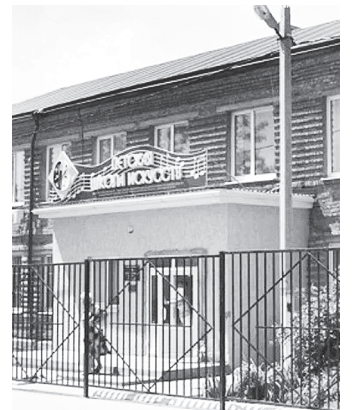
ДШИ г. Аксай.

По сообщению министерства региональной политики и массовых коммуникаций Ростовской области, на Дону продолжается реализация национального проекта «Культура». Одним из его важнейших направлений является поддержка детских школ искусств в рамках регионального проекта «Культурная среда».