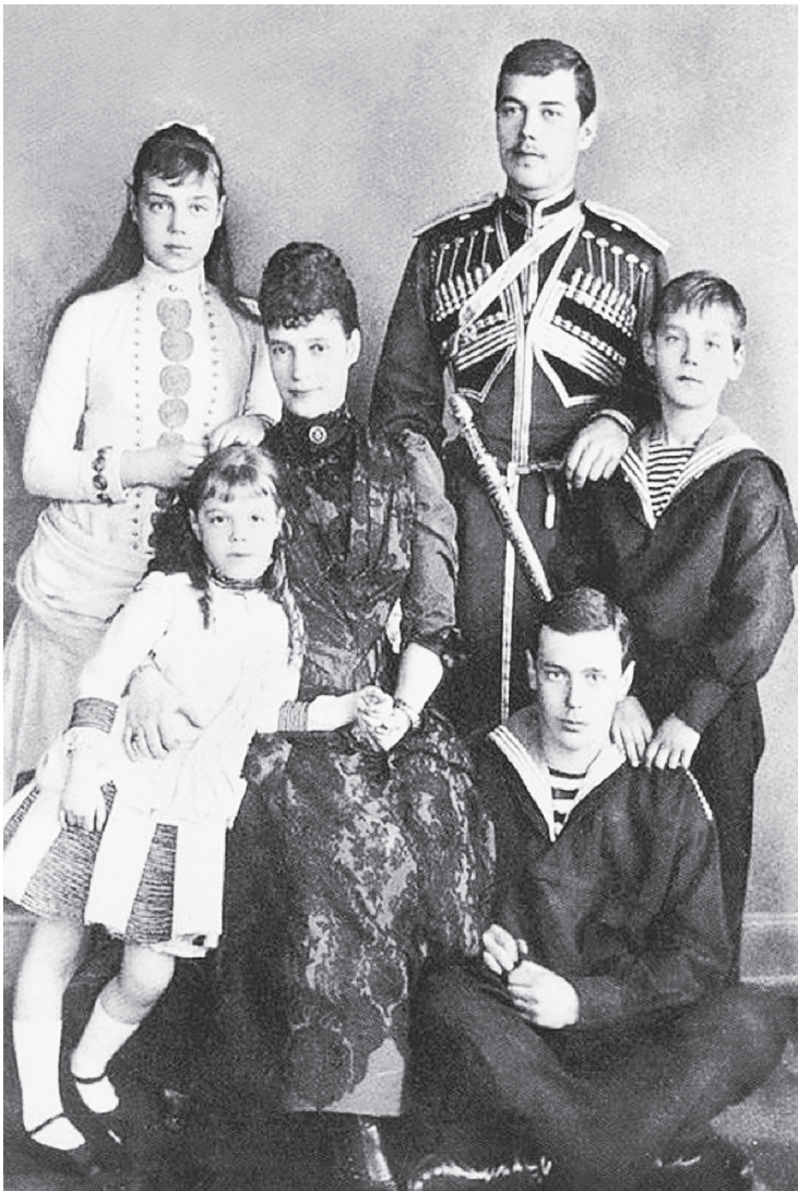
Мария Федоровна с детьми.

Также состоялась панихида по казакам, отдавшим жизнь за Отечество, и возложение цветов к воинскому мемориалу на Монастырском урочище.