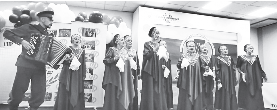
Народный вокальный ансамбль «Любить по-русски» исполняет гимн.

В нашем районе Аксайское отделение «Союза пенсионеров Дона» успешно функционирует уже на протяжении семи лет. Наши активные пенсионеры никогда не сидят без дела! Их всегда можно встретить на самых разных районных мероприятиях: будь-то праздники или субботники, на зарядке в парке или с лыжными палками на стадионе. А теперь с собственным гимном организации трудиться на благо района станет еще приятней!