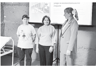
На церемонии открытия.

В Автономной некоммерческой организации Центра социального обслуживания населения «Забота и долголетие» состоялось торжественное открытие пункта проката технических средств реабилитации и «Школы ухода за маломобильными людьми». Это важный шаг к созданию более доступной среды для граждан. Это проект, поддержанный Агентством развития гражданских инициатив Ростовской области. «Забота и долголетие» выиграл грант губернатора, и на полученные средства было закуплено оборудование.